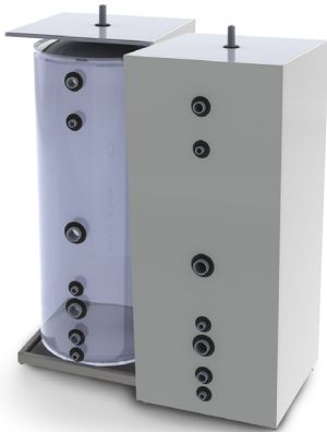
Akkumulatortank TIV 500/A

En rektangulär isolerad akkumulatortank i vitlackerat utförande. Tanken är isolerad med 45 mm mineralull på sidorna och 95 mm i toppen. Fördelaktiga ytermått gör att tanken klarar smala dörröppningar. Tanken går även att utrusta med varmvattenslingor, varmvattenberedare, solslinga och shunt. Möjlighet till alternativa muffplaceringar finns. Se följande exempel på fyra vanligt förekommande färdigt utrustade tankar.