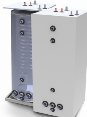
Beredartank TIV 500/FC200

Tanken är utrustad med en varmvattenslinga på 15 m, en förvärmningsslinga på 10 m samt en solslinga på 10 m (samtliga är kopparslingor). Uttag DN50 för shuntpaket 6136851. Är lämplig för ett hushåll med stor varmvattenförbrukning som vill utnyttja solvärmern optimalt.