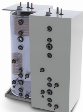
Soltank TIV 500/B15/BF10/SOL10

Används ofta för volymutökning tillsammans med ved/pellets-panna/värmepump. Anslutningarna är 2 st DN50 för exempelvis elpatron, 2 st DN32 tillopp och retur, 1 st DN25 expansion/avlutning, 3 st DN20 avtappning och termometer.